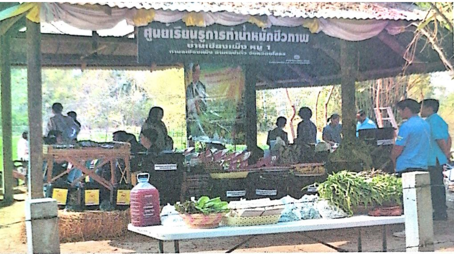
อบรมให้ความรู้เกี่ยวกับการทําน้ำหมักชีวภาพ